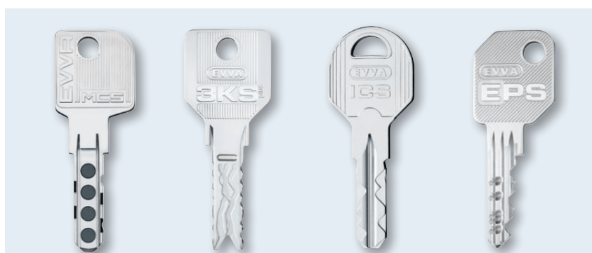
Mechanische EVVA-Systeme von links nach rechts: MCS, 3KsPlus, ICS und EPS

Die markante 3KsPlus-Schlüsselform mit ihren abgerundeten Konturen erlaubt eine gute Handhabung beim mehrmaligen Drehen des Schlüssels. Ein leichtgängiges Einführen des Schlüssels in den Schlüsselkanal des Schließzylinders wird durch die beiden abgerundeten Schlüsselspitzen und die Kurvenfräsung ermöglicht. Der Schlüssel ist symmetrisch als Wendeschlüssel ausgeführt.