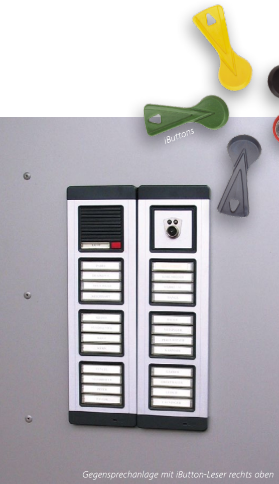
Gegensprechanlage mit iButton-Leser rechts oben